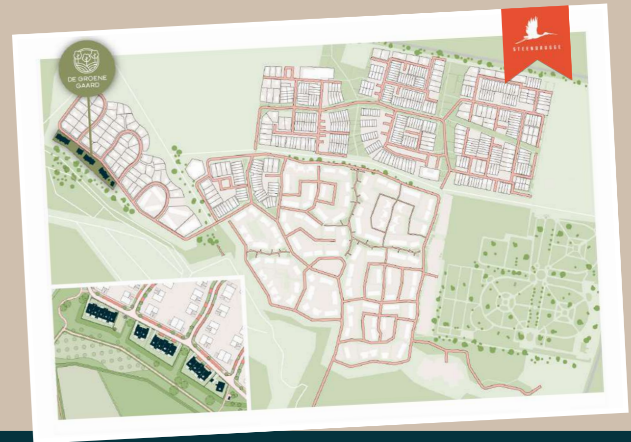
Locatie van De Groene Gaard