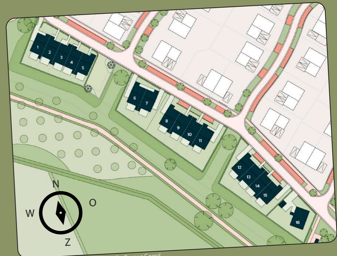
Kavelkaart met de drie erven van De Groene Gaard

Honderden jaren geleden creëerden deze drie broers elk een thuis aan de rand van de Zandwetering, bouwend aan wat bekend staat als hallehuizen. Vandaag de dag ademen de drie erven dezelfde historische charme uit en wekken ze het levendige erfgoed van Steenbrugge tot leven.